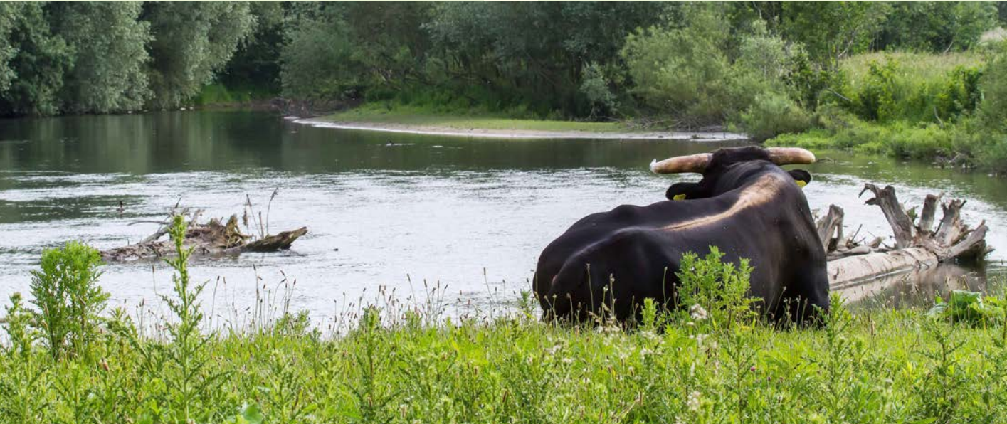
Taurusbulle