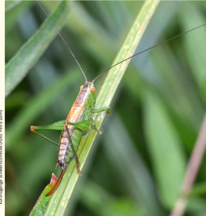
Kurzflügelige Schwertschrecke

Löffelente, Weißstorch und Kiebitze zählen zu den typischen Vögeln dieser Flussaue. Wasserfestes Schuhwerk ist empfehlenswert. Treffpunkt: 15:00 Uhr, Raiffeisenmarkt (an der B 475) zwischen Lippborg u. Heintrop, Heintroper Straße 20, 59510 Lippetal-Lippborg Leitung: Joachim Drüke