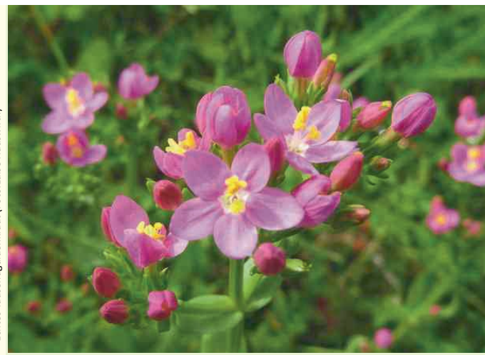
Echtes Tausendgüldenkraut

Wir wandern durch die Auenlandschaft der Klostermersch. Sie bietet alles, was eine naturnahe Aue auszeichnet: ein renaturierter Fluss Lippe, Flutrinnen, zahlreiche Auengewässer, sumpfbartige Bereiche und eine von Rindern und Pferden gestaltete vielfältige Vegetation. Je nach Wasserstand sind wasserdichte Stiefel erforderlich. Treffpunkt: 15:00 Uhr, Parkplatz Schelhasseweg 1, 59556 Lippstadt-Benninghausen Leitung: Joachim Drücke