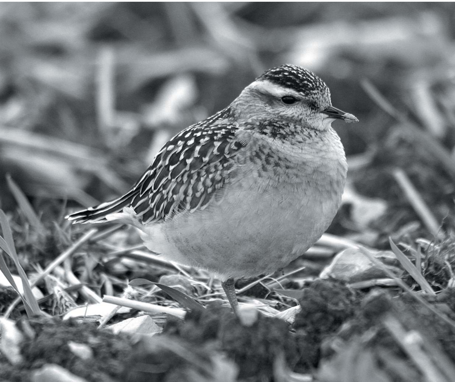
Mornellregenpfeifer, Jungvogel, Kahle Mark südöstlich Eikeloh, 23.08.2008.