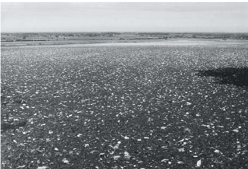
Steinige, skelettreiche Äcker sind der bevorzugte Rastplatz des Mornellregenpfeifers in der Hellwegbörde. Feldflur südlich Störmede.