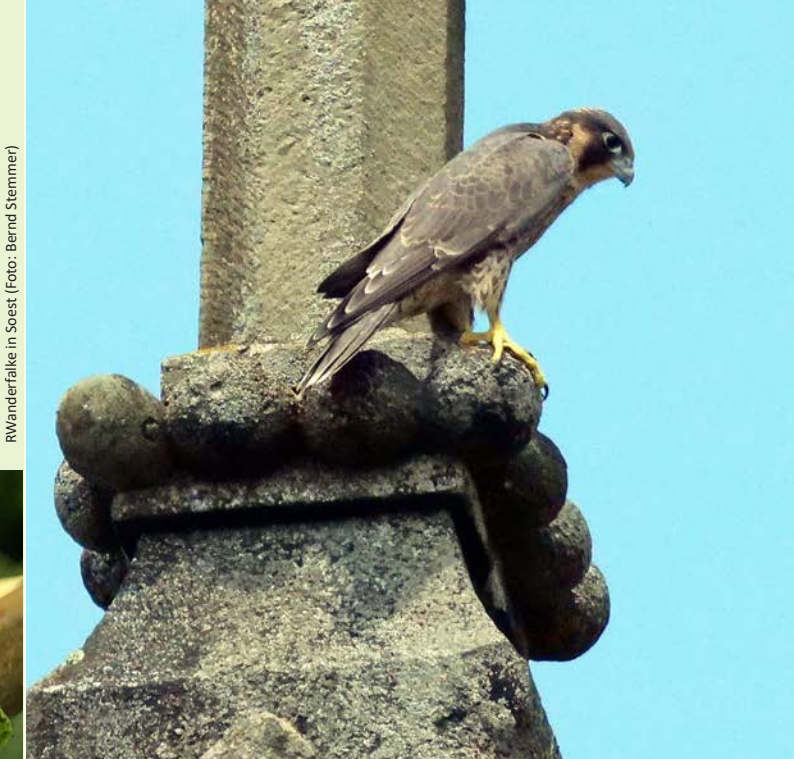
RWanderfalke in Soest