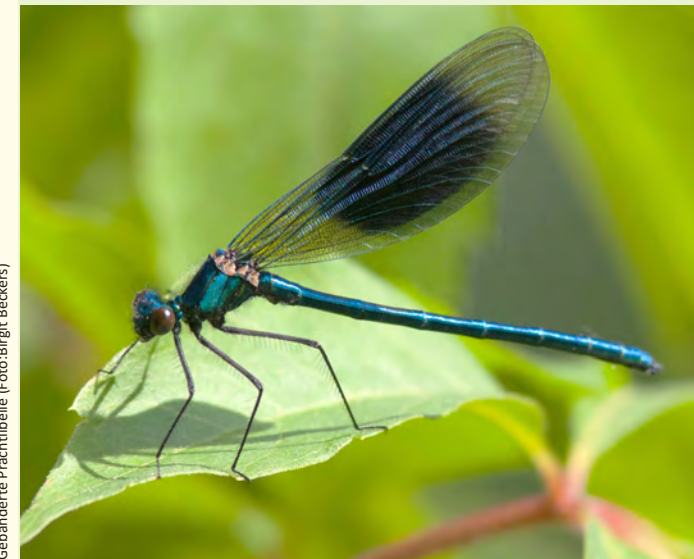
Gebänderte Prachtlibelle

Für die Fortführung unserer Naturschutzarbeit sind wir auf Ihre Unterstützung angewiesen. Unsere Veranstaltungen sind unentgeltlich, aber über eine Spende würden wir uns sehr freuen. Möchten Sie weitere Informationen über unsere Arbeit? Rufen Sie uns an oder schicken Sie uns eine E-Mail.