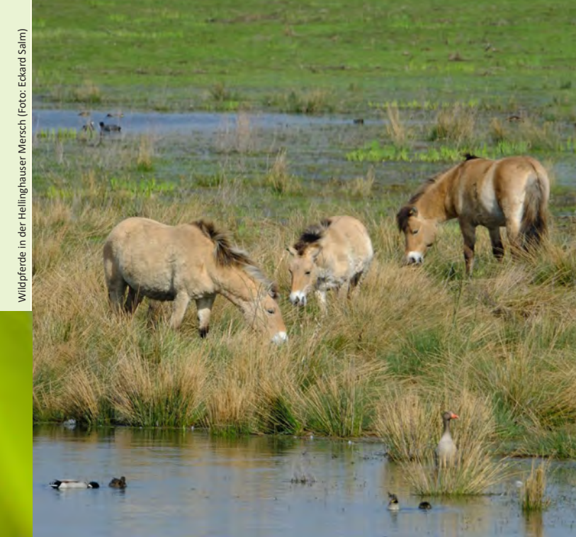
Wildpferde in der Hellinghauser Mersch