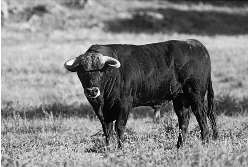
Ein Kampfstier mit Merkmalen des Auerochsen: nach innen geschwungene Hörner, schwarzes Fell mit hellem Aalstrich auf dem Rücken und hellem „Flotzmaul“.