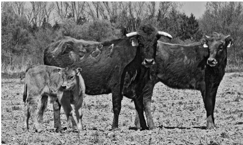
Besucona mit Nachwuchs. Deutlich ist ein Teil ihres spanischen Brandzeichens („581“) zu sehen.