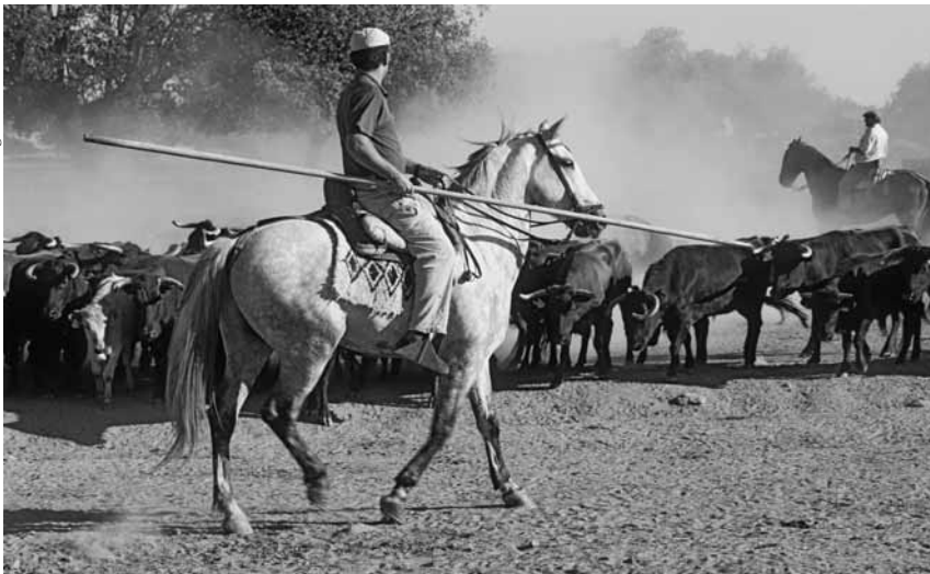
So werden die Lidias zusammengetrieben.

misstrauische Spanier endlich davon überzeugen, dass das Geld wirklich über verschiedene Zwischenstationen in Madrid angekommen war. Erst daraufhin wurde unsere Lidia für den Transport freigegeben.