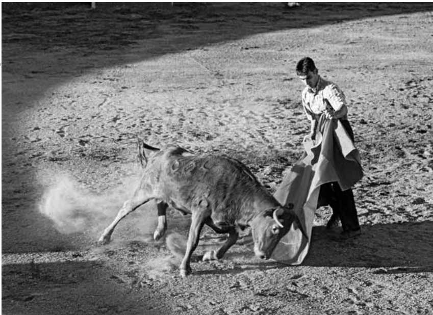
Junge Lidia-Kuh bei der „Tienta“ - einem Test auf Mut und Schnelligkeit, der über ihr Schicksal entscheidet.