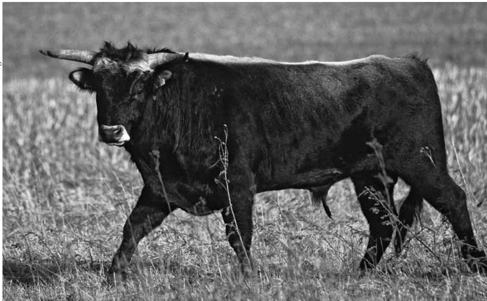
Loco, ein Sohn von Aguaclara und dem Heckrindbullen Mator