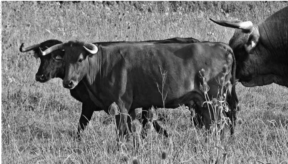
Aguaclara (vorn) und Barbasombra, die beiden anderen Kampfkühe der ABU.